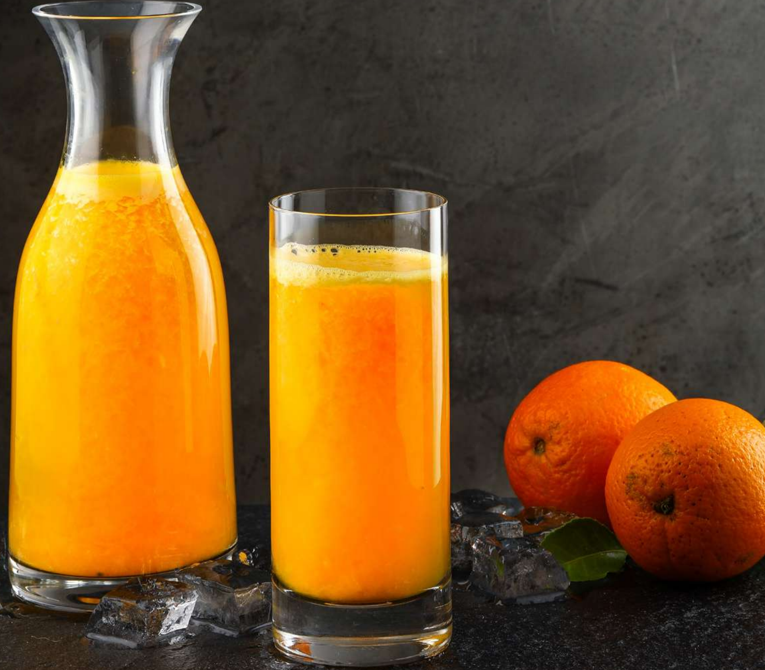
TAZE SIKILMIŞ PORTAKAL SUYU

Carême Restaurant, mevsimin en taze meyvelerini sizin için özenle seçer. Günlük olarak hazırlanan eşsiz lezzetteki taptaze meyve suları, öğünlerinize eşlik etmek için sizi bekliyor.